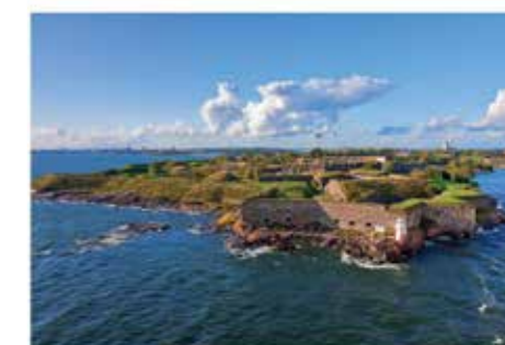
Forteresse de Suomenlinna Finlande - XVIII e siècle

Cette exposition a été réalisée par la Ville de Besançon. Elle invite à parcourir le globe et le temps à la découverte de citadelles et fortifications inscrites sur la liste du patrimoine mondial de l'Unesco, ou engagées dans cette démarche.