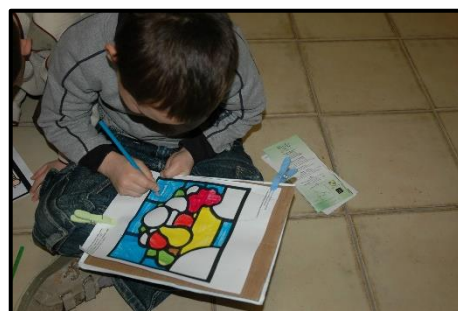
Coloriage en cours de réalisation