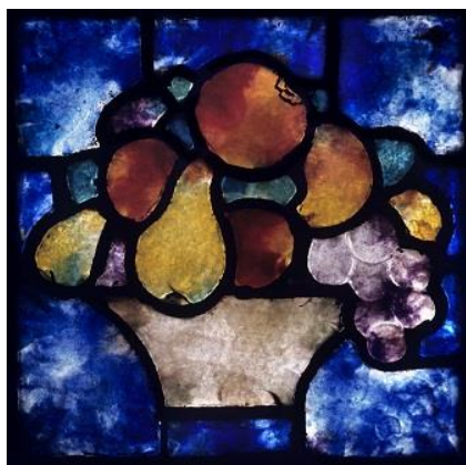
Vitrail « Coupe de fruits »

Pendant 90 minutes, les jeunes publics suivront une visite guidée sur François Décorchemont, avec une présentation de sa vie et de son œuvre, répondront à un questionnaire illustré, puis réaliseront des coloriages à partir des vitraux exposés en permanence au musée.